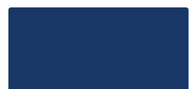
Sultan Blue MACal 9738-07 PRO