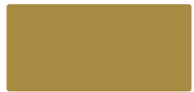
Gold MACal 9778-00 PRO