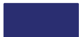
European Blue MACal 9738-08 PRO