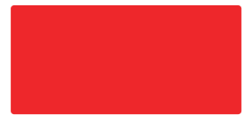
Tomato Red MACal 9758-06 PRO