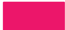
Cyclamen MACal 9758-03 PRO