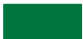
Mint Green MACal 9748-01 PRO