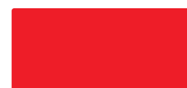
Paprika MACal 9758-14 PRO