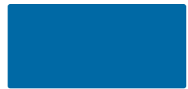
Blue MACal 9738-00 PRO