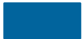
Sea Blue MACal 9738-06 PRO