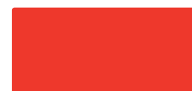
Poppy Red MACal 9758-04 PRO