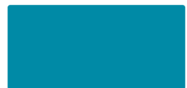
Light Blue MACal 9738-04 PRO