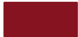
Burgundy MACal 9758-02 PRO