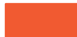
Orange MACal 9702-06 PRO